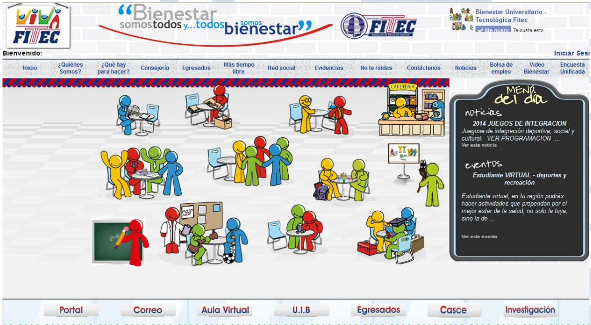
Imagen Institucional Micrositio de Bienestar