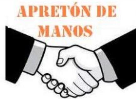
APRETÓN DE MANOS