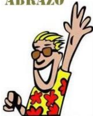
SALUDO CON LA MANO